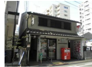
京都御池柳馬場郵便局まで徒歩2分