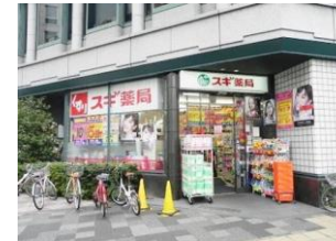
スズン薬局 京都市役所前店まで徒歩7分