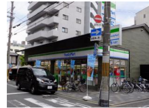
ファミリーマートまで徒歩1分