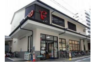
フレスコ・御池店まで徒歩2分

Le Pin Verre (ルパンヴェール) 御所南 2LDK 65.28㎡ 12月空き予定!