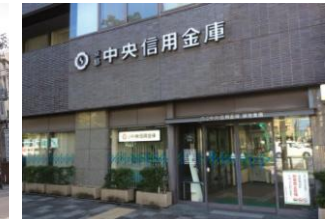
京都中央信用金庫まで徒歩6分