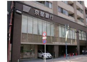
京都銀行まで徒歩5分